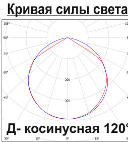
Д- косинусная 120°

* - для модификаций: Ex-ДСО хх-12 / 24 / 33 / 43 / 45 / 60 / 65 Вт